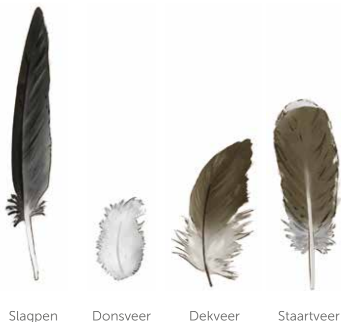
Figuur 1 Verschillende soorten veren. Wanneer hennen veren eten zullen ze eerst de dons- en dekveren nemen.

Wanneer ze een suboptimaal voer aangeboden krijgen of er plots van voersamenstelling veranderd wordt, kunnen hennen overgaan tot het eten van veren. Dit doen ze om te compenseren voor tekorten in eiwitten of onoplosbare vezels. Veren eten kan leiden tot het uittrekken en eten van veren van soortgenoten. De aanwezigheid van donsveertjes in het strooisel wijst er op dat de uitgevallen veren niet opgegeten worden. Slagpennen en staartveren zijn te groot om door hennen gegeten te worden. Daarom moet er enkel op dons- en eventueel dekveren gelet worden.