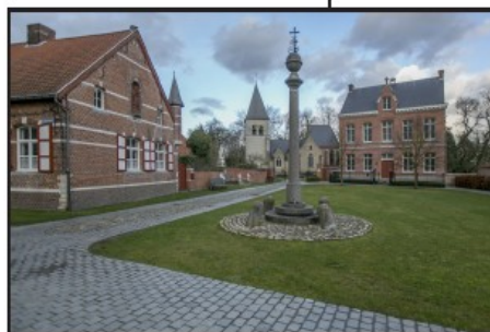
Het centrum van Gestel, met centraal de schandpaal.