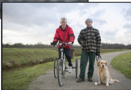
Marc en Luc op de Netedijken.

• “Zowel in de stad als op het platteland stijgt de vraag naar stille plekken”, zegt minister van Natuur Joke Schauvliege (CD&V). “Stilte en rust hebben een heilzaam effect op mensen. Daarom erkennen we bepaalde gebieden die nog echt stil zijn. Het is de bedoeling dat het gemeentebestuur van zo'n gebied in het beleid rekening houdt met de stiltekwiteit van de omgeving, zodat die niet verstoord wordt. In een landelijke omgeving zijn er vooral natuurlijke geluiden. Maar ook geluiden afkomstig van bewoners, bezoekers, landbouw, natuur- of bosbeheer kunnen deel uitmaken van het geluidsklimaat in een landelijk stiltegebied”, klinkt het. (bep)