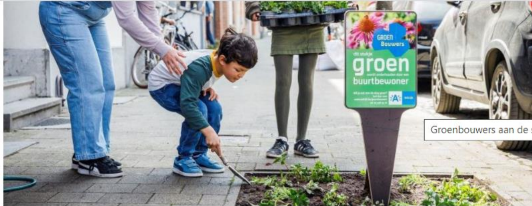
Groenbouwers aan de slag in de Sportstraat