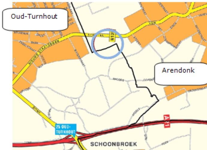
Fig. 1: Situering plangebied gemeentegrens