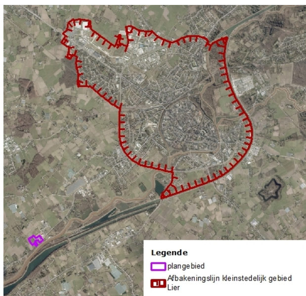
Fig 1: situering tov kleinstedelijk gebied Lier