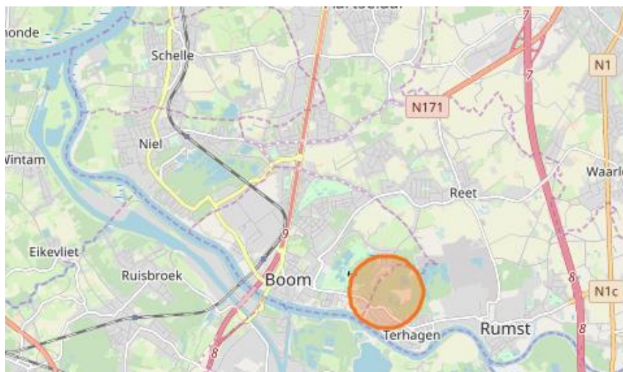
Figuur 1: situering macro