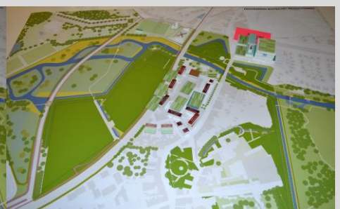
Maquette groep 6