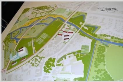
Maquette groep 2