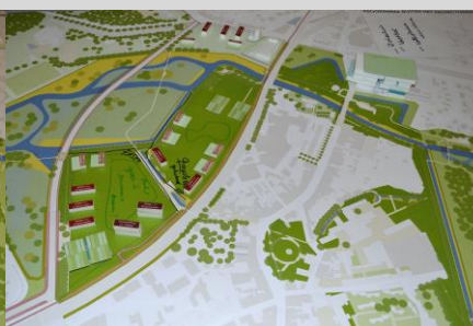
Maquette groep 5