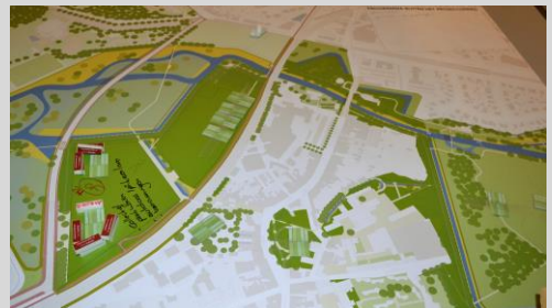
Maquette groep 3