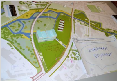
Maquette groep 1