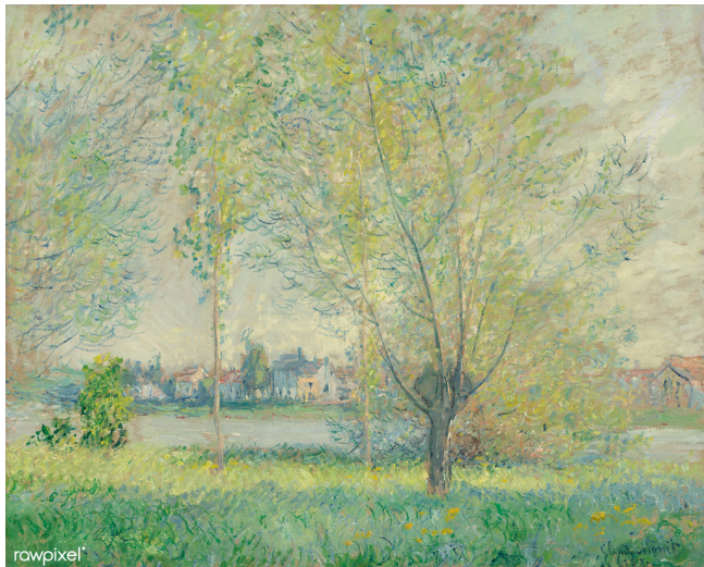
Claude Monet : Wilgen van Vetheuil (1880)