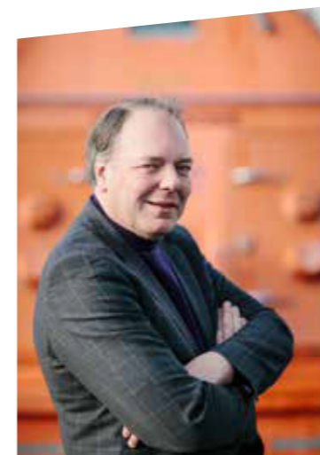
Ludwig Caluwé, Gedeputeerde provincie Antwerpen

Het provinciebestuur is een regionaal verankerd (democratisch verkozen) bestuursniveau dat midden in onze regio staat en alle partners samen brengt. Onze natuurlijke partners zijn de steden, gemeenten en hun intercommunales, maar ook de Vlaamse en Europese overheid. Onze bondgenoten zijn de ondernemers, de sector- en beroepsfederaties en de sociale partners, zowel binnen de drie Regionale Sociaaleconomische Overlegcomités (RESOC) als binnen de Talentenhuisen. De kennisinstellingen, de Vlaamse provincies en de Nederlandse provincies binnen de Vlaams-Nederlandse Delta zijn onze metgezellen. Op de snijpunten van deze (beleids)assen – speerpuntsectoren en uitdagingen - maakt de provincie Antwerpen het verschil.