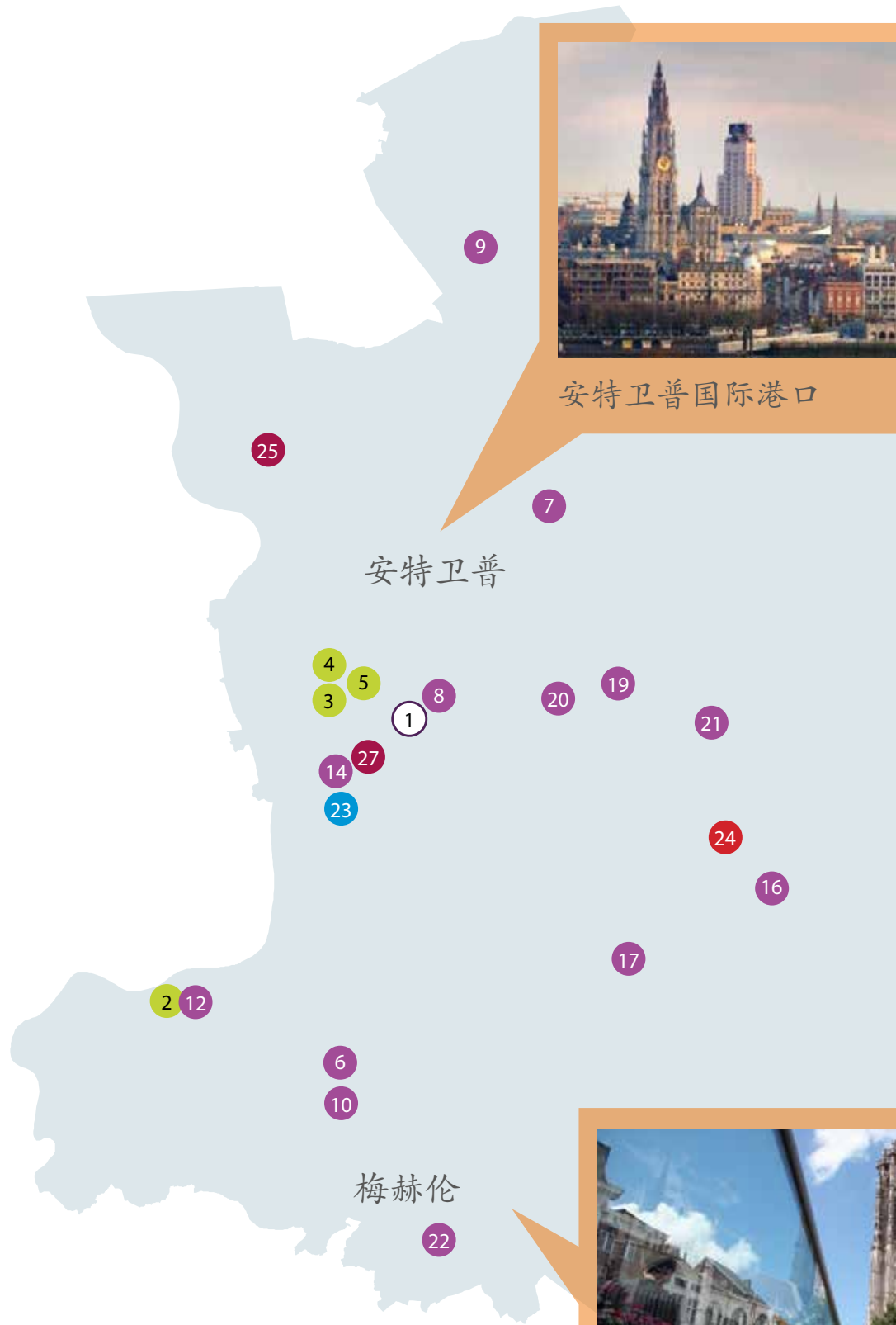
安特卫普国际港口