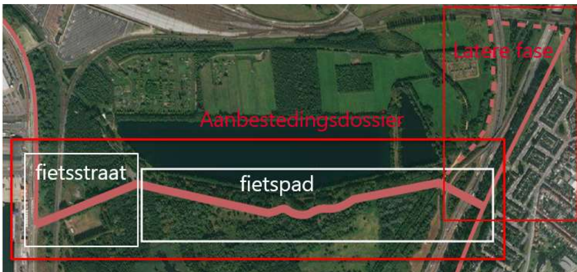
Figuur 1: Situering F12, Havenverbinding

De fietsostrade F12 verbindt Antwerpen met Bergen op Zoom. Ze loopt langs de A12 in Ekeren, doorkruist de Bospolder, gaat verder langs de Noorderlaan in de haven en door de dorpen Berendrecht en Zandvliet.